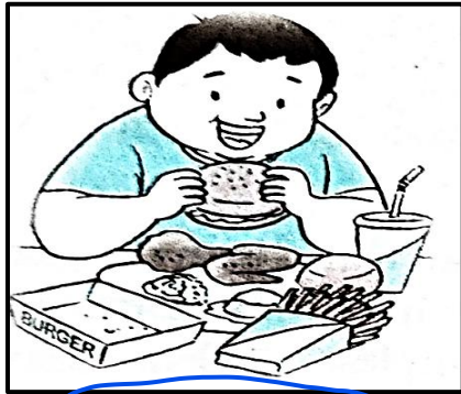
Menggemari makanan segera

Berdasarkan rajah di bawah, huraikan pendapat anda tentang punca-punca obesiti dalam kalangan kanak-kanak . Panjang huraian hendaklah 50 hingga 80 patah perkataan.